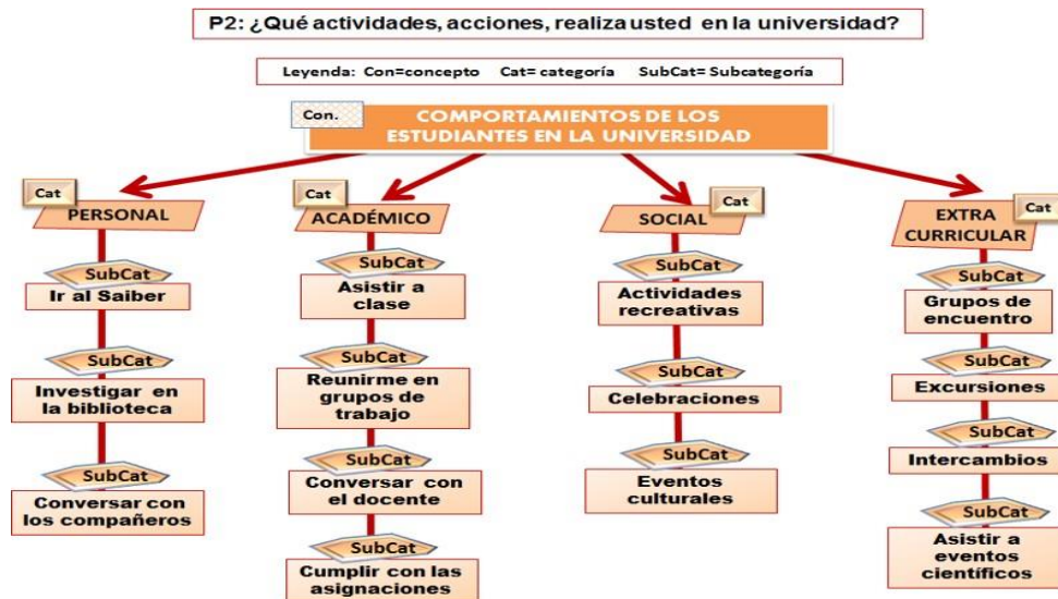
Figura 2: Actividades que realiza el estudiante en la universidad. Nota: Tomado de la entrevista semiestructurada. Pregunta N° 2. Elaborado por la autora (2020)

Puede notarse que los informantes (estudiantes) agruparon sus comportamientos en la universidad en cuatro categorías: Personal, académico, social y extracurricular. Los comportamientos personales son: ir al Saiber, investigar en la biblioteca y conversar con sus compañeros. Los comportamientos académicos: ir a clase, reunirse en grupos de trabajo, conversar con el docente y cumplir con las asignaciones de las cátedras. En relación con los comportamientos sociales, estos estudiantes manifestaron realizan actividades recreativas, celebraciones y eventos culturales y las actividades extracurriculares (cuarta categoría), las realizan a través de grupos de encuentro, excursiones, intercambios en la universidad como con otras universidades y asistencia a eventos científicos.